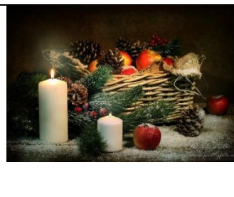
А) Новый год